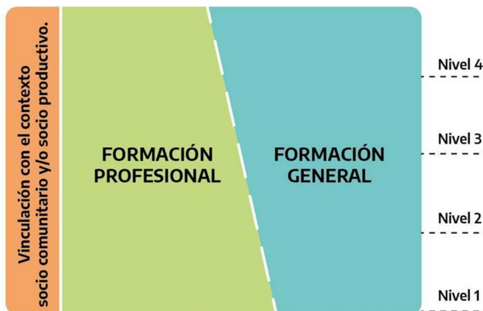
Gráfico N° 1

Siguiendo estos criterios, el diseño curricular se configura de acuerdo con una lógica que procura expresarse en el siguiente gráfico: